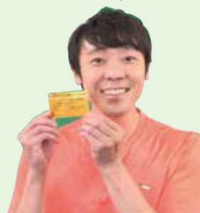
「おかあさんといっしょ」第11代 体操のお兄さん 小林よしひささん (よしお兄さん)