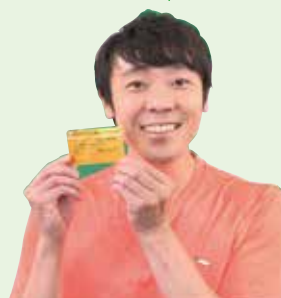
「おかあさんといっしょ」第11代 体操のお兄さん 小林よしひささん (よしお兄さん)