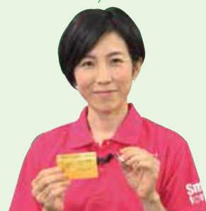
元ショートトラック スピードスケート日本代表 勅使川原郁恵さん